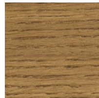
800200 Antique oak