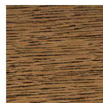
800132 Kouřený dub